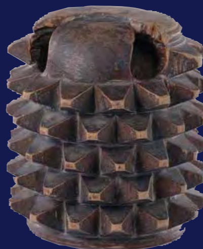
Pallone: Bracciale um 1650, Schutzhandschuh (Holz), höfisches Ballspiel