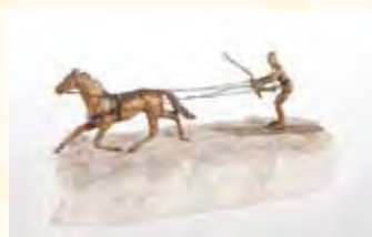
Skijöring, Bronze auf Marmorsockel um 1890