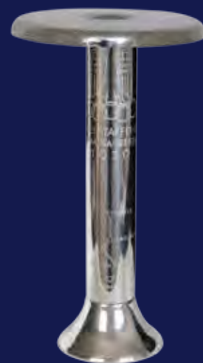
Olympische Fackel Berlin 1936