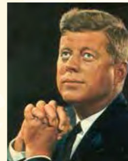
Der Kennedy Mord