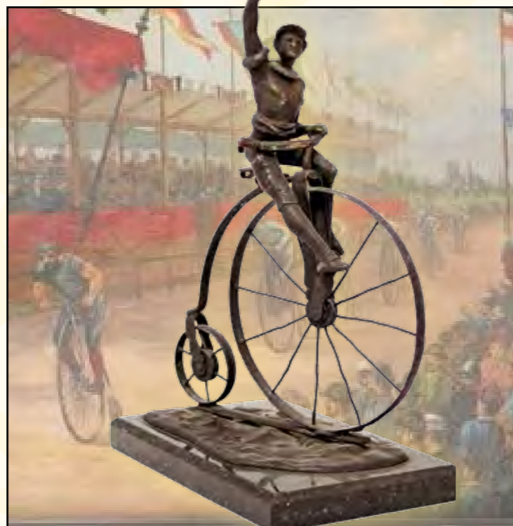
Hochradfahrer, Wiener Bronze um 1800. Hintergrund: Leipziger Rennen 1885

Die Ausstellung wurde zum letzten Mal 1978 zum 200. Geburtstag von „Turnvater Jahn“ in der Kasseler Orangerie gezeigt.