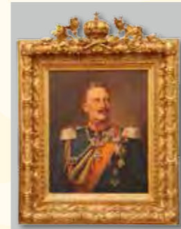
Kaiserzeit, I. Weltkrieg